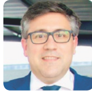
Presidente Pedro Fernández Alén CNC